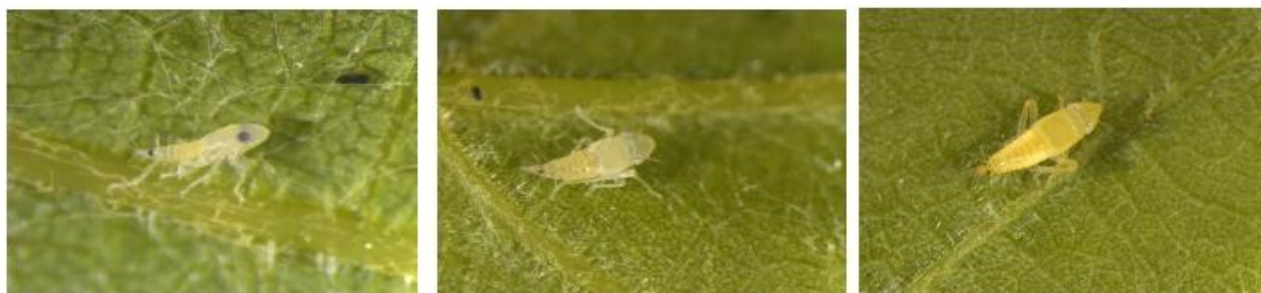
Neanide di prima età (L1). Neanide di seconda età (L2). Neanide di terza età (L3).

Il DDR n. 13645 del 14 maggio 2026 “Misure di lotta obbligatoria contro la Flavescenza dorata della vite nella Regione Veneto per l’anno 2026” è stato pubblicato nel sito istituzionale dell’UO Fitosanitario al link: https://www.regione.veneto.it/web/fitosanitario/flavescenza-dorata